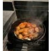
3.お楽しみのディナータイム メスティン（アルミ製の箱型飯盒）を使って炊き込みご飯、ローストチキンなど